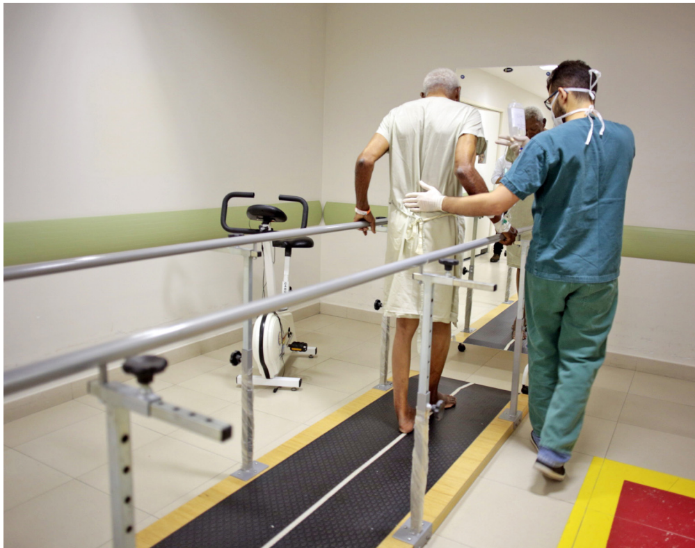
REABILITAÇÃO DE PACIENTE EM UNIDADE DE ALTA COMPLEXIDADE DA REDE ESTADUAL. O FLUXO DE ATENDIMENTO PASSA PELA REGULAÇÃO.

Através das ações de controle, é possível, por exemplo, organizar o fluxo de atendimento dos hospitais do interior do Estado, contribuindo de forma decisiva para desafogar a rede hospitalar de Fortaleza.